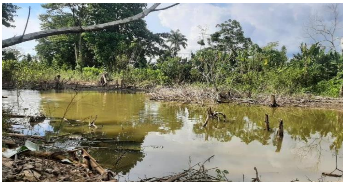
FIGURA N°03: ÁREAS AGRÍCOLAS AFECTADAS POR LA INUNDACIÓN