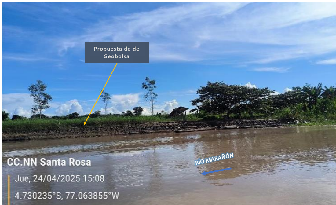
FIGURA N°01: RIBERAS AFECTADAS POR EROSIÓN FLUVIAL