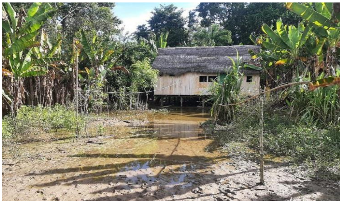
FIGURA N°02: VIVIENDAS AFECTADAS POR LA INUNDACIÓN